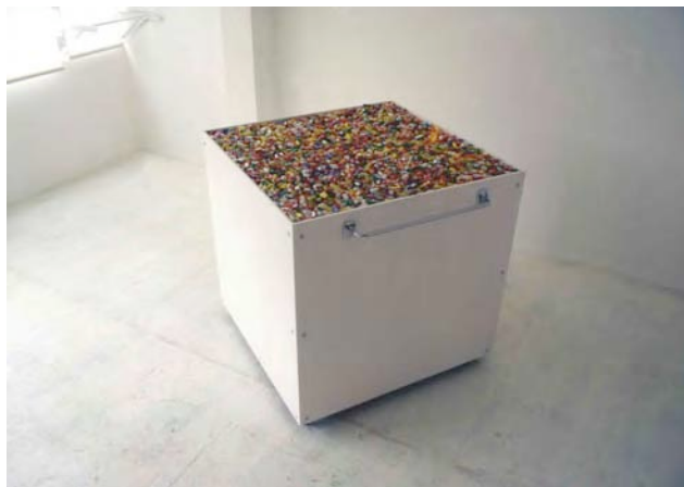
Un Gusto Passeggero, 1994. Wood, Stainless, candy, Paint. 200x200x210cm.

L'idea del patchwork, con altri attributi, finalità e proiezioni mentali, si ritrova in Un gusto passeggero (1994), opera inedita, esposta in questa sede per la prima volta al pubblico. Decine di chilogrammi di cioccolatini dall'involucro multicolore sono contenuti in un basamento monolitico incavo. Tali bonbon sono i "Cri Cri", tipico prodotto dolciario torinese. In questo caso assistiamo ad una simbiosi tra la struttura bianca che contiene i cioccolatini, manufatto eseguito dall'autore e il ready made del prodotto della tradizione della città subalpina. Quale sia il rapporto e il confine tra la preziosità della struttura minimale, pesantemente presente, eseguita artigianalmente dall'autore e i Cri Cri, prodotti meccanicamente da un'industria dolciaria, l'artista lo chiede allo spettatore. Inoltre, nella percezione estetica, Hirose introduce l'elemento "gusto", importante caratteristica sensoriale che troviamo in molte altre sue opere.