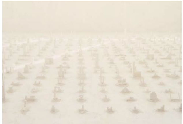
Architect without Architecture, 1989-94. Wood, Paint, Marble powder. Dimensions variable

superficie di una stanza, innumerevoli piccoli tasselli in legno dipinto di bianco, dalle forme geometriche varie. L'impressione è quella di una distesa di edifici in miniatura, di una maquette urbanistica in scala, di un plastico di un quartiere avveniristico situato alla periferia di una ipotetica metropoli del futuro. Me l'elemento "finzione" è pregnante, e bisogna fare i conti, anche in questo caso, con il concetto di indefinità e indeterminatazza, con l'arbitrarietà delle certezze dell'apparenza e i significati reconditi insiti nella realtà delle cose.