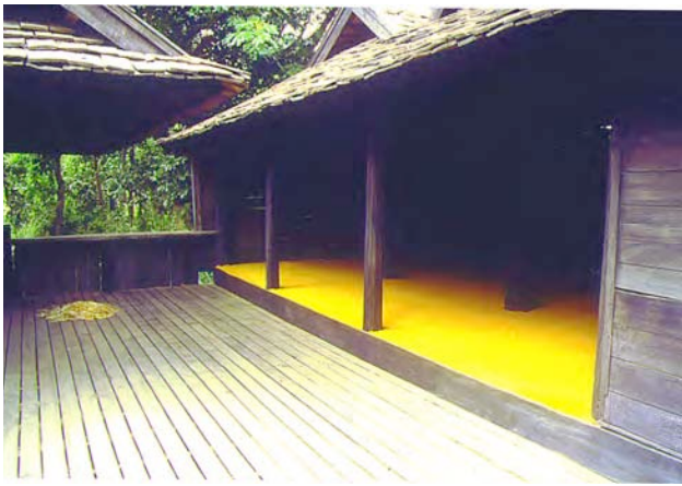
Spice Room, 1995. Curry powder, rice, vinyl. Dimensions variable.

In questa installazione ambientale troviamo numerosi e complessi rimandi concettuali. Così come per l'Alecchino e i cioccolatini torinesi, l'elemento "limone" diviene l'emblema della nostra penisola (Goethe stesso definì l'Italia come "il paese dove fioriscono i limoni"). La fragranza d'agrumi è in realtà un disorientamento percettivo operato dall'autore con l'ausilio di uno spray d'essenza al limone. Il gioco di destabilizzazione sensoriale sta, in questo caso, nella relazione tra naturale e artificiale. L'astante crede di respirare un profumo naturale: in realtà è stato precedentemente spruzzato nell'aria un'essenza di aroma limone artificiale. Ma l'artificialità viene nuovamente meno al momento in cui si svela che nella bomboletta spray è contenuta un'essenza naturale estratta dal limone. Il meccanismo di scambio delle parti, della dualità e del doppio è così avviato.