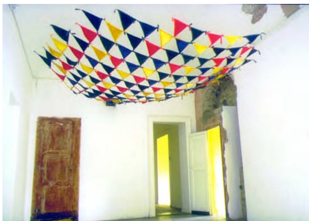
Arlechino, 1998. Cloth, Fishing line. 260x280x2cm.

Hirose opera un transfert dalla pura e essenziale quotidianità alla dimensione artistica e questa è senz'altro la caratteristica più coerente di tutto il suo operato. Oggetti semplici, molte volte "invisibili" nel trascorrere giornaliero, sono posti in qualità di soggetto (o complemento) per un'ipotesi di riflessione sistematica sul ruolo delle cose, sul significato dei simboli che esse spesso ricoprono, prendendo in analisi lo spazio che sta tra significato e parola.