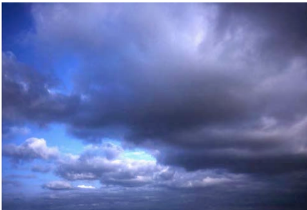
Bangkok 1995, 1996. ilfochrome print on aluminum. 75x50cm.

dubbi e non dà mai risposte univoche, il tutto in un crocevia di geografie e appartenenze, in un viaggio meditativo dal reale al metafisico, spirituale ma razionalmente presente al tempo stesso.