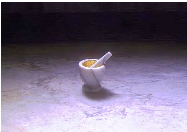
Bocca d'oro, 1993. Marble, gold leaf. 20x20x21cm

La relazione tra verità e menzogna, naturale e artificiale, reale e immaginario è ben espletata in Bocca d'Oro (1993): un mortaio ricostruito in marmo bianco è rivestito, nel cavo interno, di una mistura di vera placatura d'oro zecchino e di una falsa laminatura dorata. Naturalmente è impossibile riconoscere nell'amalgama la differenza tra le due cose. Questo è esattamente il modello linguistico di Hirose: un oggetto comune, banale, appartenente alla nostra quotidianità, viene preso come modello visivo. Il mortaio, uno strumento di lavoro utilizzato in chimica, in medicina e in cucina, dalla forma unica, ingloba in sé proiezioni e situazioni immaginative molto differenti. Si tratta della mutevolezza del simbolo di un'unica immagine; un'entità che si sposta in continuazione da una forma chiusa al concetto trasferibile d'esistenza.