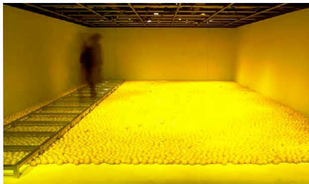
Lemon Project 03, 1997. Flesh lemon, Glass, stainless, paint, lemon oil. Dimentions variable.

In Lemon Project 03, presentato per la prima volta a Tokyo lo scorso anno, la pavimentazione di una intera sala della galleria viene totalmente ricoperta da un "tappeto/natura" composto da sette quintali di limoni veri. Le pareti della sala sono dipinte di un giallo molto simile al colore naturale degli agrumi. Entrando nell'ambiente il fruitore è immediatamente catturato, oltre che dall'abbaglio del colore giallo totalizzante, da un intensissimo profumo di limone. Attraversando una pedana costruita in acciaio e plexiglas lo spettatore arriva dall'altra parte della stanza, dove incontra l'artista che gli offre una limonata spremuta sul momento.